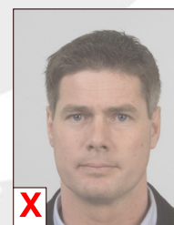
D. Onvoldoende contrast (flets)