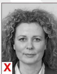
A. Zwart / Wit*