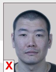
C. Onnatuurlijke weergave