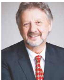
Hervé Doyen Burgemeester

Met deze brochure willen we u helpen om een publieke woning te vinden in Jette en omstreken en u de bestaande steunmaatregelen voorstellen als u een woning op de privémarkt zoekt (of moet zoeken).