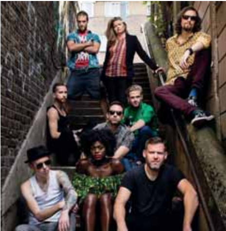
London Afrobeat Collective