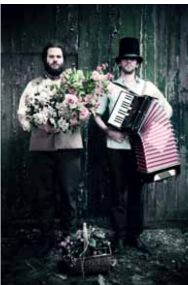
The Summer Rebellion