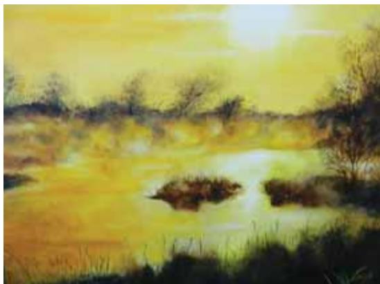
Een organisatie van de Schepen van Franstalige Cultuur en de Cercle des Collectionneurs de Jette

In haar professioneel leven werkt ze als chemicus. Haar passie balanceert tussen wetenschappelijk verlangen en de begeerte naar buitengewone kleuren. Haar mysterieuze doeken ademen dit ook duidelijk uit.