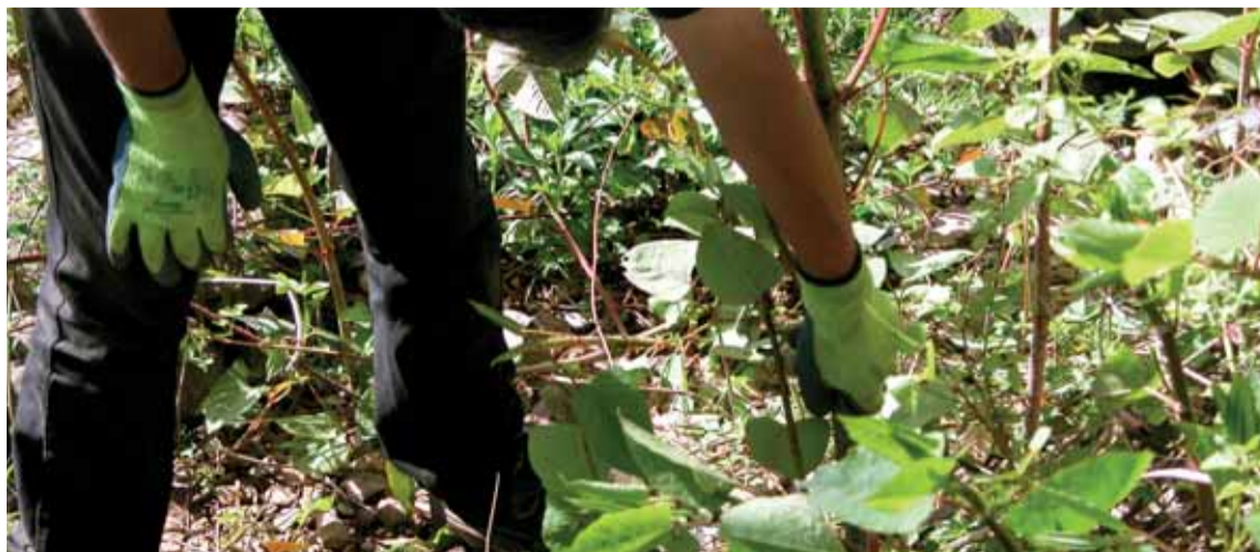
Een initiatief van het College van Burgemeester en Schepenen van de gemeente Jette en de schepenen van Duurzame ontwikkeling en Leefmilieu

Afspraak op de parking voor de speeltuin op de H. Liebrechtlaan