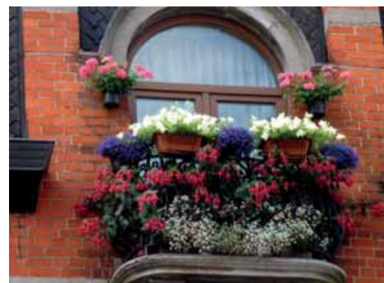
Een organisatie van de Jetse eco-ambassadeurs, op initiatief van de Schepenen van Leefmilieu