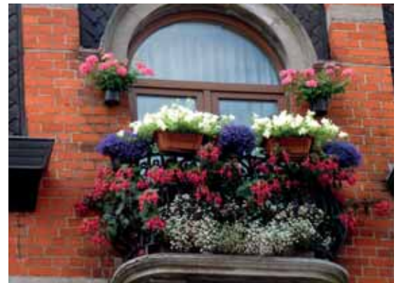
Een organisatie van de Jetse eco-ambassadeurs, op initiatief van de Schepenen van Leefmilieu