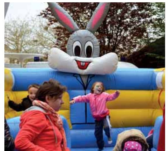
Een initiatief van de vzw Promotie van Jette, met de steun van de Schepen van Economisch Leven