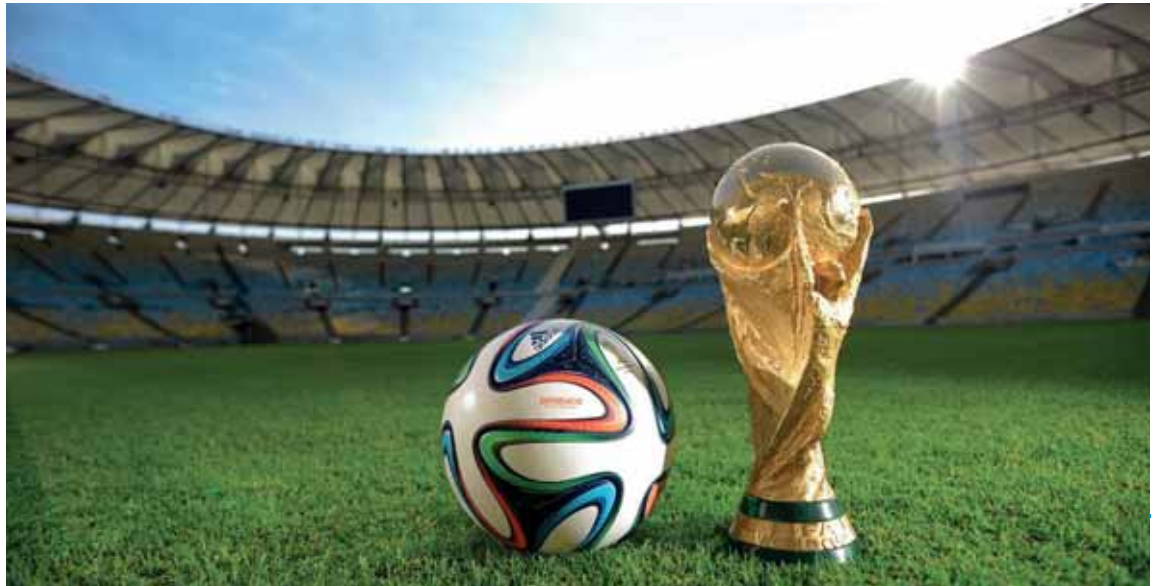
Een initiatief van de Schepen van Economisch Leven, de vzw Sport te Jette en Go Jette

Dit evenement zorgt er niet alleen voor dat de sportliefhebbers samen kunnen genieten van het grootste voetbaltoernooi ter wereld, maar ook dat de handelszaken op en rond het plein een duwtje in de rug krijgen. De toegang tot het plein is gratis, maar om de veiligheid te verzekeren zullen er maximum 3.000 toeschouwers toegelaten worden. De politie- en preventiediensten zullen aanwezig zijn om de veiligheid te garanderen. Daarom ook meteen een oproep. Laat ons er samen voor zorgen dat het een groot voetbalfeest wordt, met een spetterende sfeer maar ook in alle veiligheid.