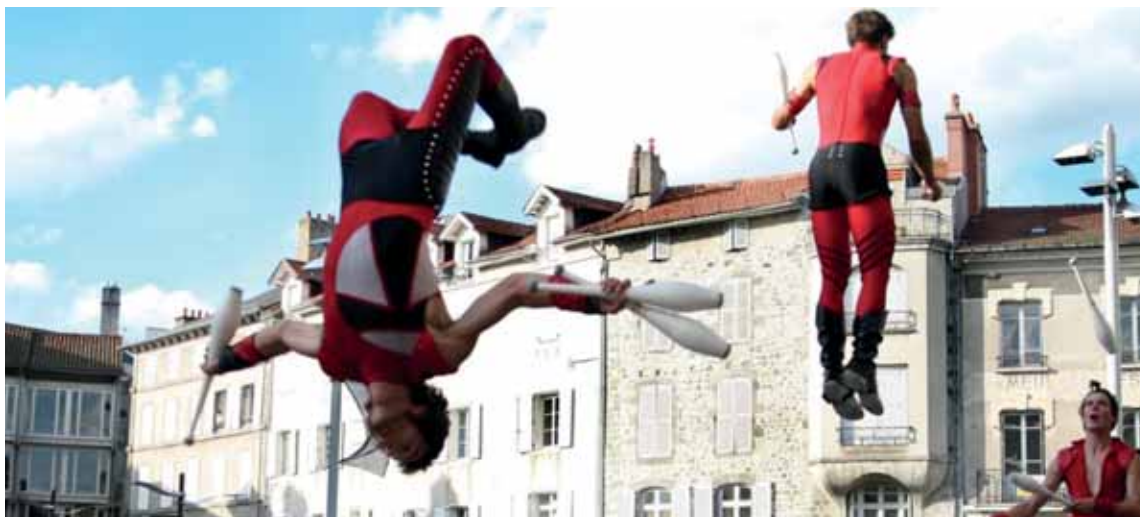
Een initiatief van de Schepen van Nederlandstalige Cultuur

Iets na 16u is het dan tijd voor de hoofdact, met Les Urbaindigènes. Verwacht je aan een specta-