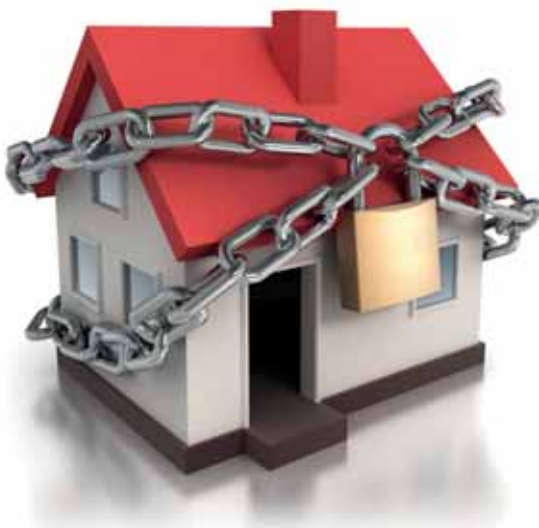
Operatie Rozet is een actie op initiatief van de Burgemeester en de Schepen van Preventie

Vanaf 8 mei 2014 gaan de gemeenschapswachten in verschillende Jetse wijken van deur tot deur in het kader van de Operatie Rozet. Het doel is om de Jettenaren te sensibiliseren rond inbraakpreventie.