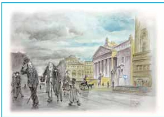
De Beurs, ter hoogte van het voormalig klooster, waarvan de monniken mochten bedelen.