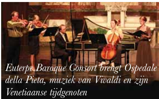
Euterpe Baroque Consort brengt Ospedale della Pieta, muziek van Vivaldi en zijn Venetiaanse tijdgenoten

Info en reservatie: cultuur@jette.irisnet.be - 02.423.13.73