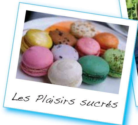
Les Plaisirs sucrés