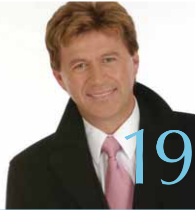
15 maart 2012 55+ Festival