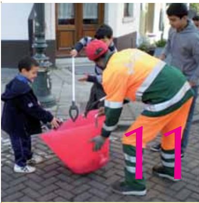
17 maart 2012 Grote lenteschoonmaak in uw wijk