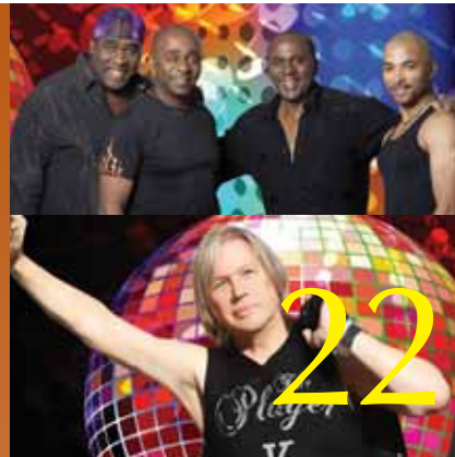
17 maart 2012 Nacht van de Jetse Sporters