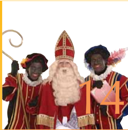
3 december 2011 Sinterklaas in Jette