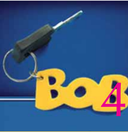
Nieuwe Bob campagne