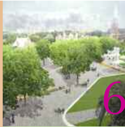
Infotoonstelling en infovergadering Kardinaal Mercierplein