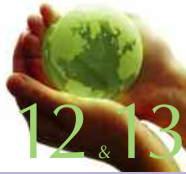
De prioriteiten van de Lokale Agenda 21