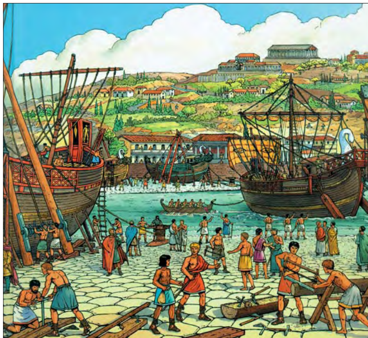
Copyright - Casterman - "Les voyages d'Alix" de Marc Henniquiau et Jacques Martin

Tot 15 februari 2004, kan u in Jette traditioneel alles leren over de geschiedenis van de zeevaart. Sinds meer dan 22 jaar, kunnen de liefhebbers van de scheepvaart terecht in de zalen van de Oude Abtswoning van Dieleghem voor de jaarlijkse tentoonstelling Navexpo, die er door het Centre culturel de Jette wordt georganiseerd.