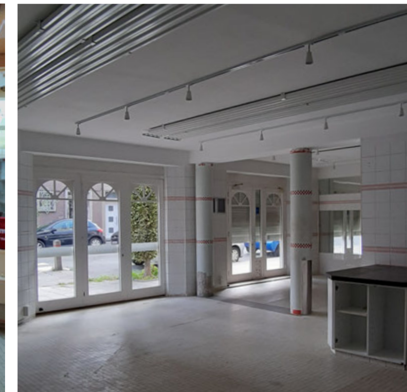
Magasin après travaux / Winkel na werken