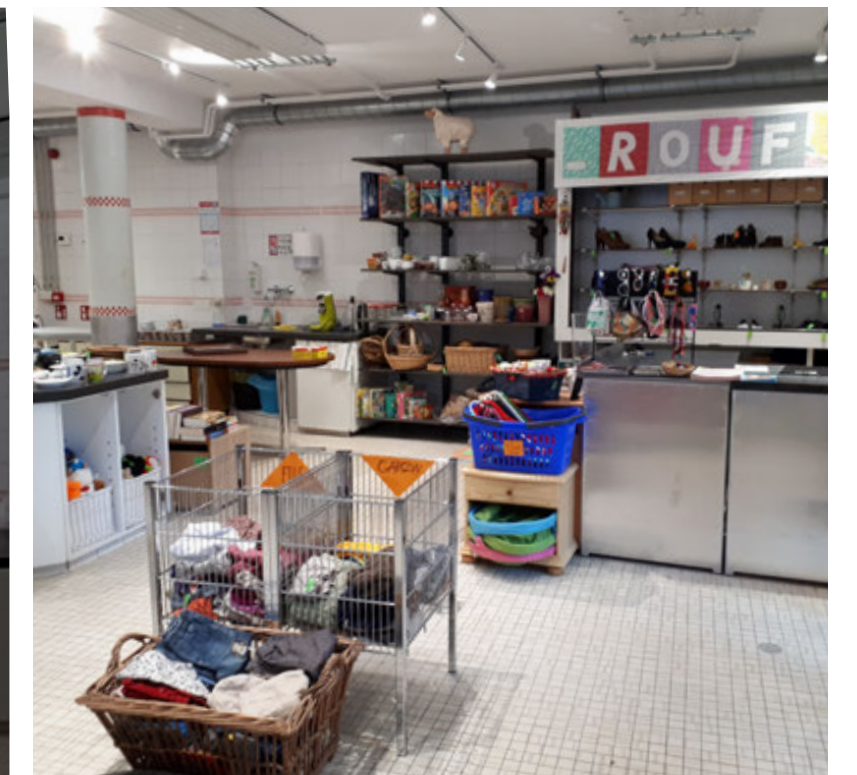
Magasin après ouverture / Winkel na opening