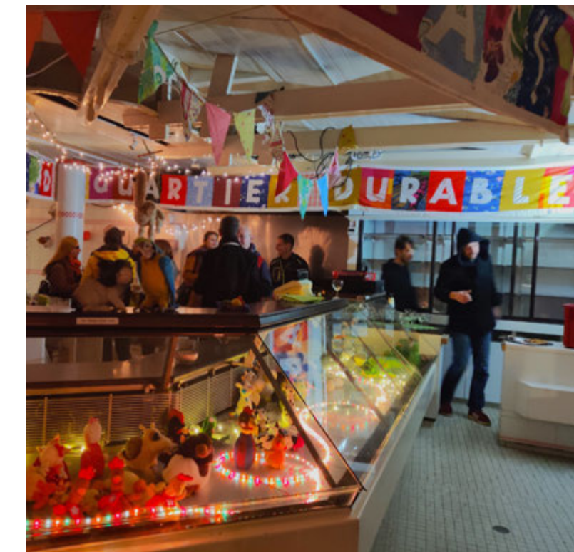
Magasin avant travaux / Winkel voor werken