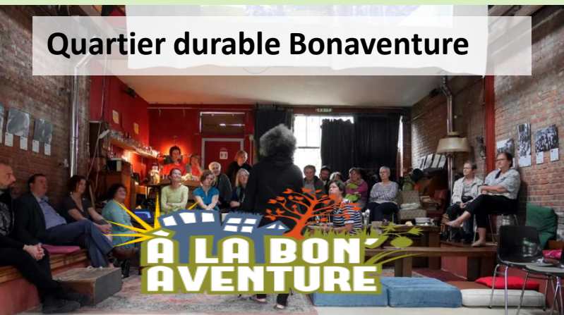
Quartier durable Bonaventure