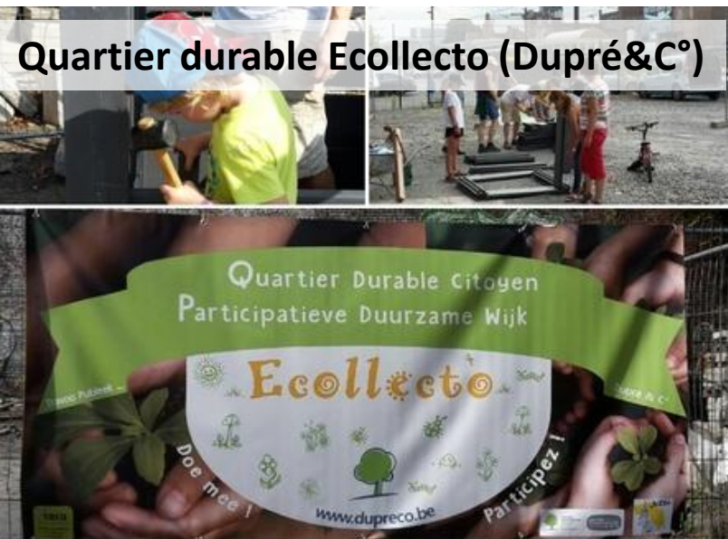
Quartier durable Ecollecto (Dupré&C°)