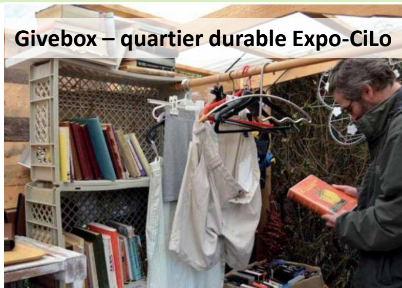
Givebox – quartier durable Expo-CiLo