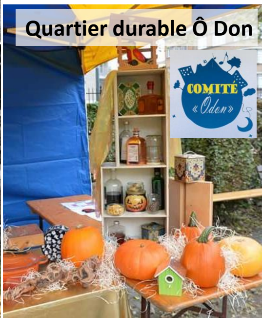
Quartier durable Ô Don