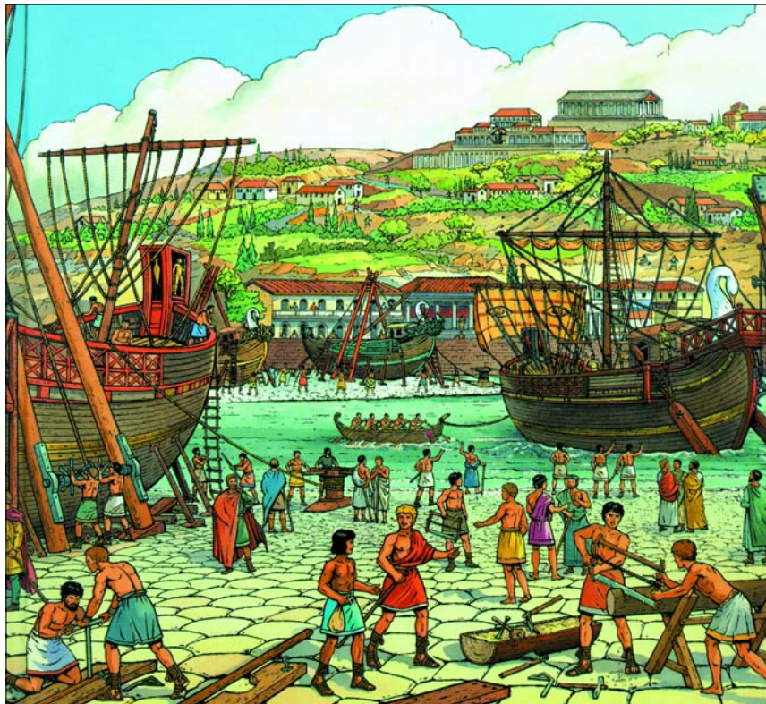
Copyright - Casterman - "Les voyages d'Alix" de Marc Henniquiau et Jacques Martin

Du 10 janvier au 15 février 2004, Jette a rendez-vous avec l'histoire de la navigation. C'est désormais une tradition ! Depuis plus de 22 ans, les amoureux de la navigation se retrouvent dans les salles de la Demeure abbatiale de Dieleghem pour l'exposition annuelle NAVEXPO, produite par le Centre culturel de Jette.