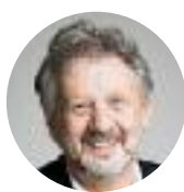
HERVÉ DOYEN BOURGMESTRE