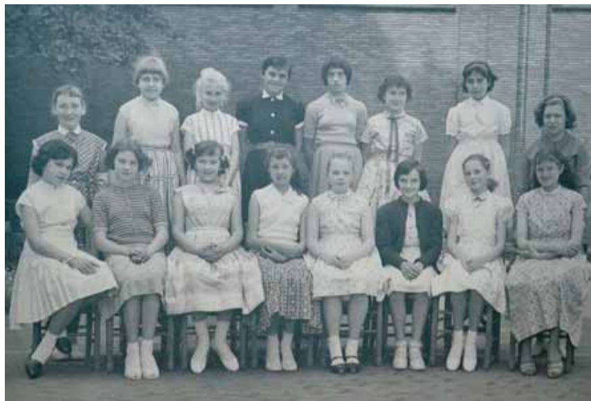
Ecole Jacques Brel – rue Esseghe, 101 ecole_jacquesbrel@yahoo.fr – 02.421.19.10