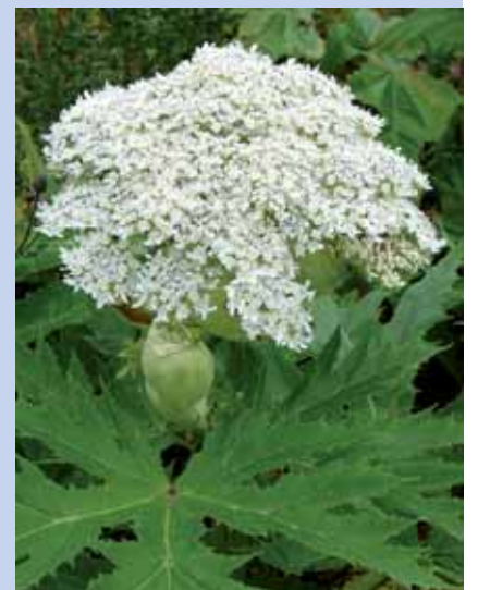
Berce du Caucase