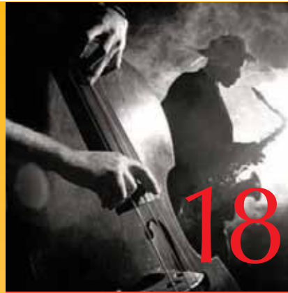
17 juin 2011 Jazz Jette June