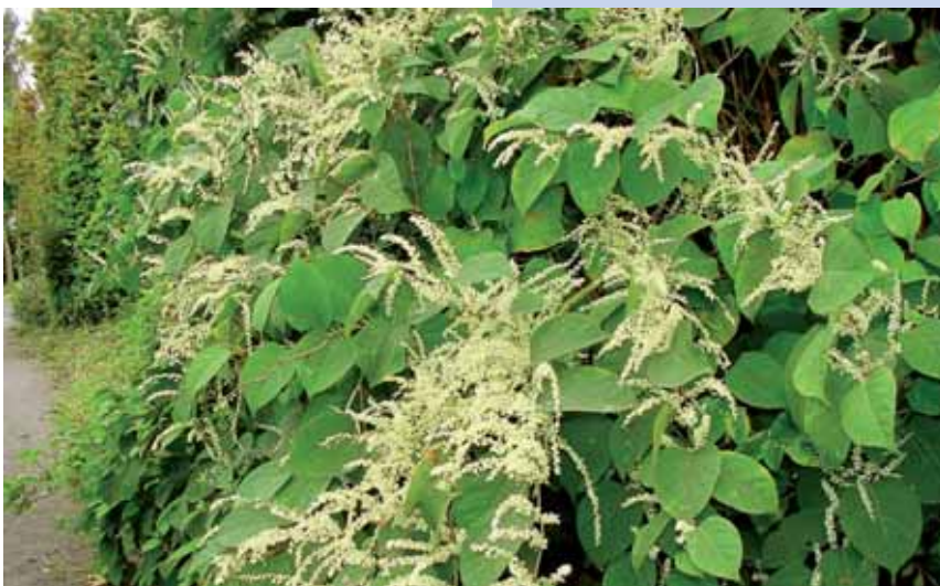
Renouée du Japon

Renseignements: www.alterias.be – info@alterias.be