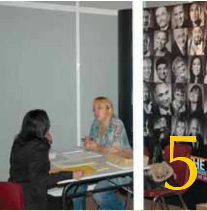
23 juin 2011 Bourse de l'emploi