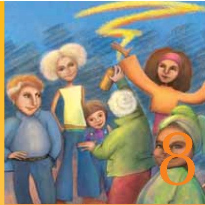
26 juin 2011 Recipro'city