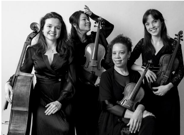
GoYa Quartet © Clémentine Van der Bent

Voor het laatste concert van 2021 palmen fluitist Toon Fret