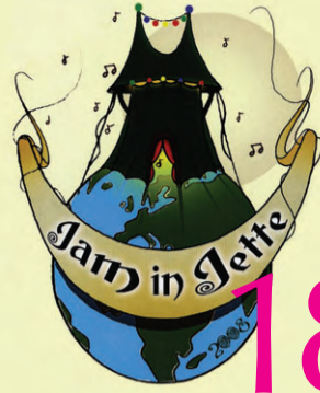
18 17 mai 2008 Jam 'in Jette