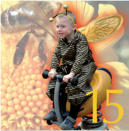
15 12 mai 2008 Portes ouvertes serres et Ferme pour Enfants