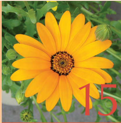
15 Concours de fleurissement de façades